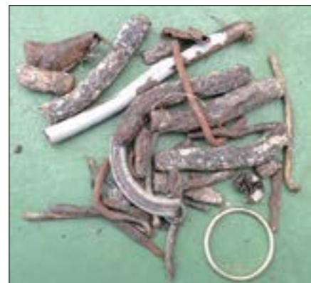
Ausbeute nach 14-tägigem Einsatz unserer Magneten (Ehering als Referenz rechts unten im Bild)

Optionale Verschleißelemente „INNODUR“ verlängern die Lebensdauer der Vario 2 -Mischschnecke signifikant.