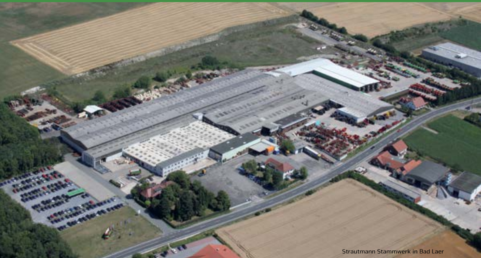
Strautmann Stammwerk in Bad Laer